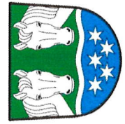
Obec Stáj – Příloha č. 1 k Obecně závazné vyhlášce o poplatku za užívání veřejného prostranství